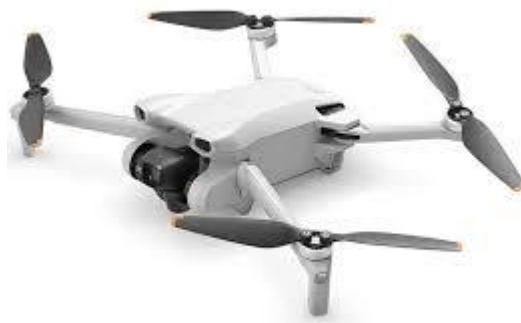
Dron Mavic Mini 3

En la cámara del dron ajustar la configuración del balance de blancos, pasar de automático a manual y dejar el valor del balance de blancos como se indica a continuación según la referencia del dron.